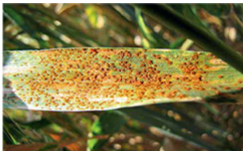
Silné napadnutie hrdzou