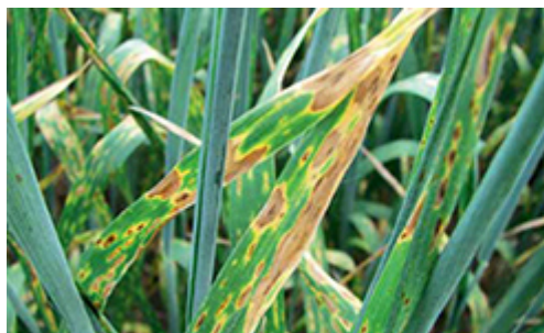
Príznaky napadnutia Helmitosporiázou