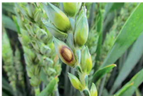
Klas napadnutý septoriózou plevovou

Už niekoľko rokov patrí k najobľúbenejším prípravkom na našom fungicídnom trhu. Amistar Xtra za to vďačí viacerým faktorom, ktoré oceňujú predovšetkým pestovatelia obilnín, repky olejnej, slnečnice a cukrovej repy. Výborná účinnosť proti rôznym druhom hubových chorôb, široké možnosti použitia vo viacerých kultúrnych plodinách a aj priaznivý vplyv na fyziologické procesy ošetrovaných rastlín tvoria skutočnú záruku bohatej úrody, vysokej kvality a zisku.